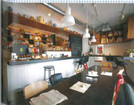
a'DandC 1階にあるcaffe nero http://www.caffenero.jp